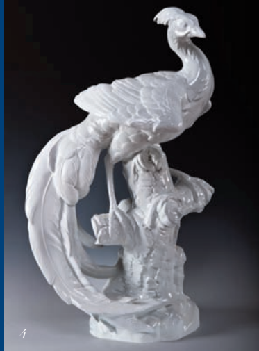
4 | Hermann Fritz Schlesinger: Paradiesvogel 1922