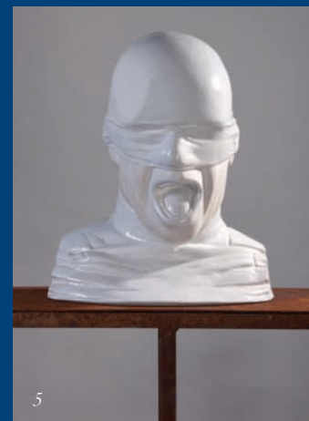
5 | Detlef Reinemer: Hiob 2002